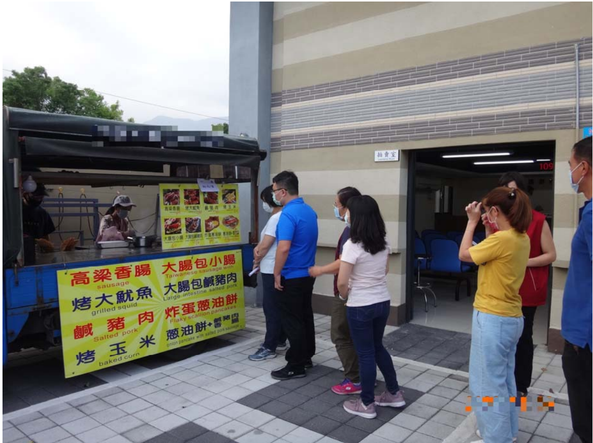
(蔥油餅阿伯擺攤資料照片)