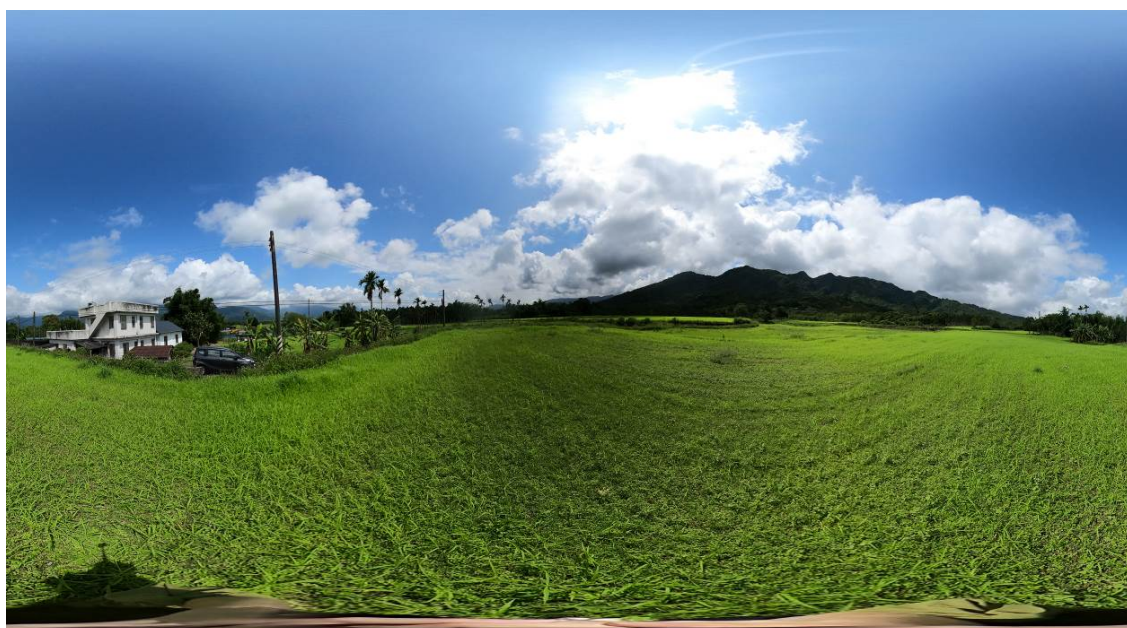
(面山景光復鄉馬佛段土地，網址： https://reurl.cc/7k03Vd )