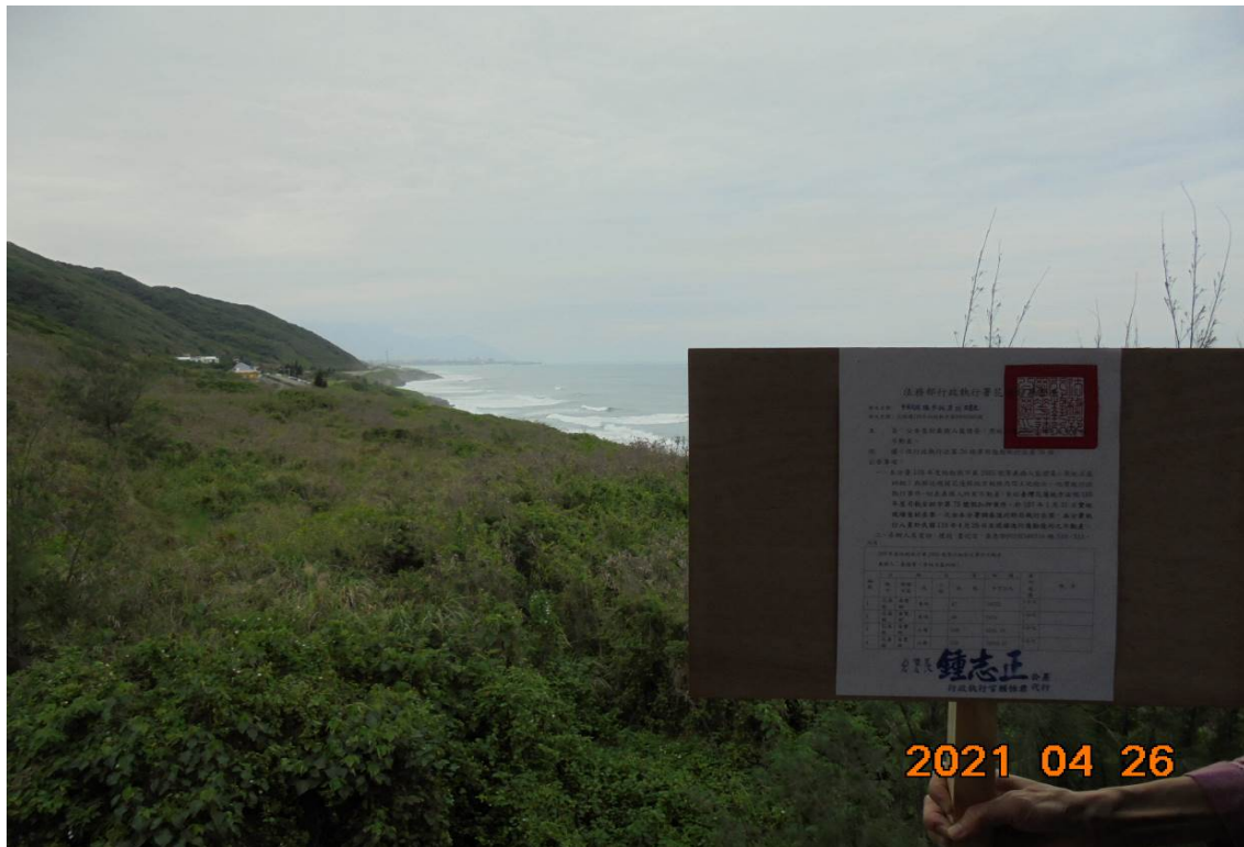
(面海景壽豐鄉土地)