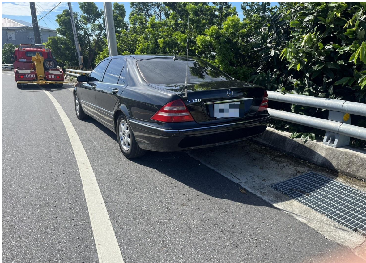
(註銷賓士車輛遭拖吊前往保管場停放)