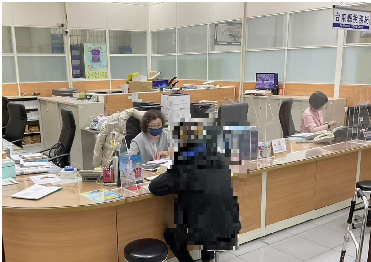
(義務人至花蓮分署臺東辦公室繳清罰鍰)