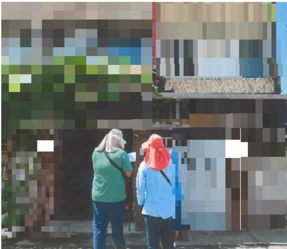
(書記官會同地政人員查封不動產時發現座落基地疑義)