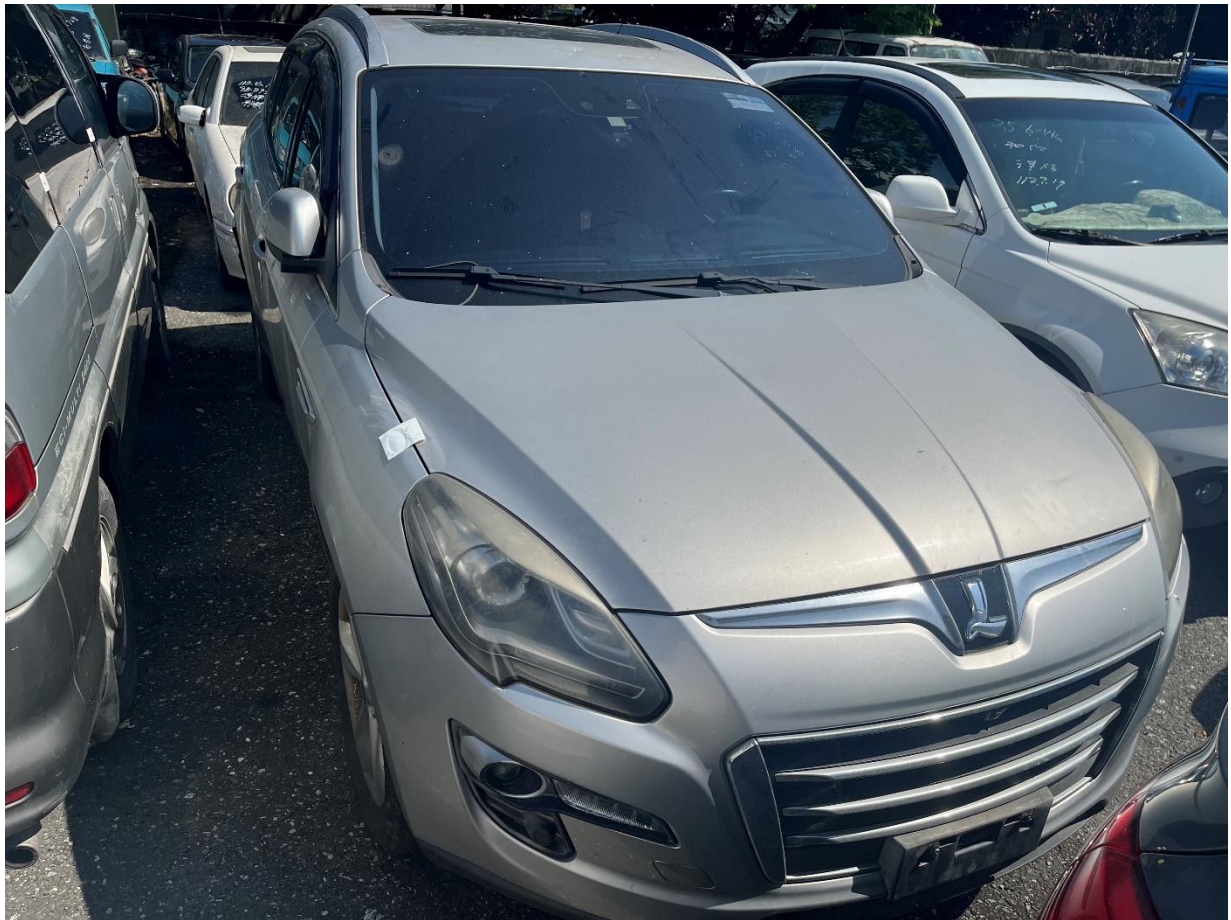
(上午10時位於花蓮縣妨害交通車輛移置保管場拍賣納智捷休旅車)