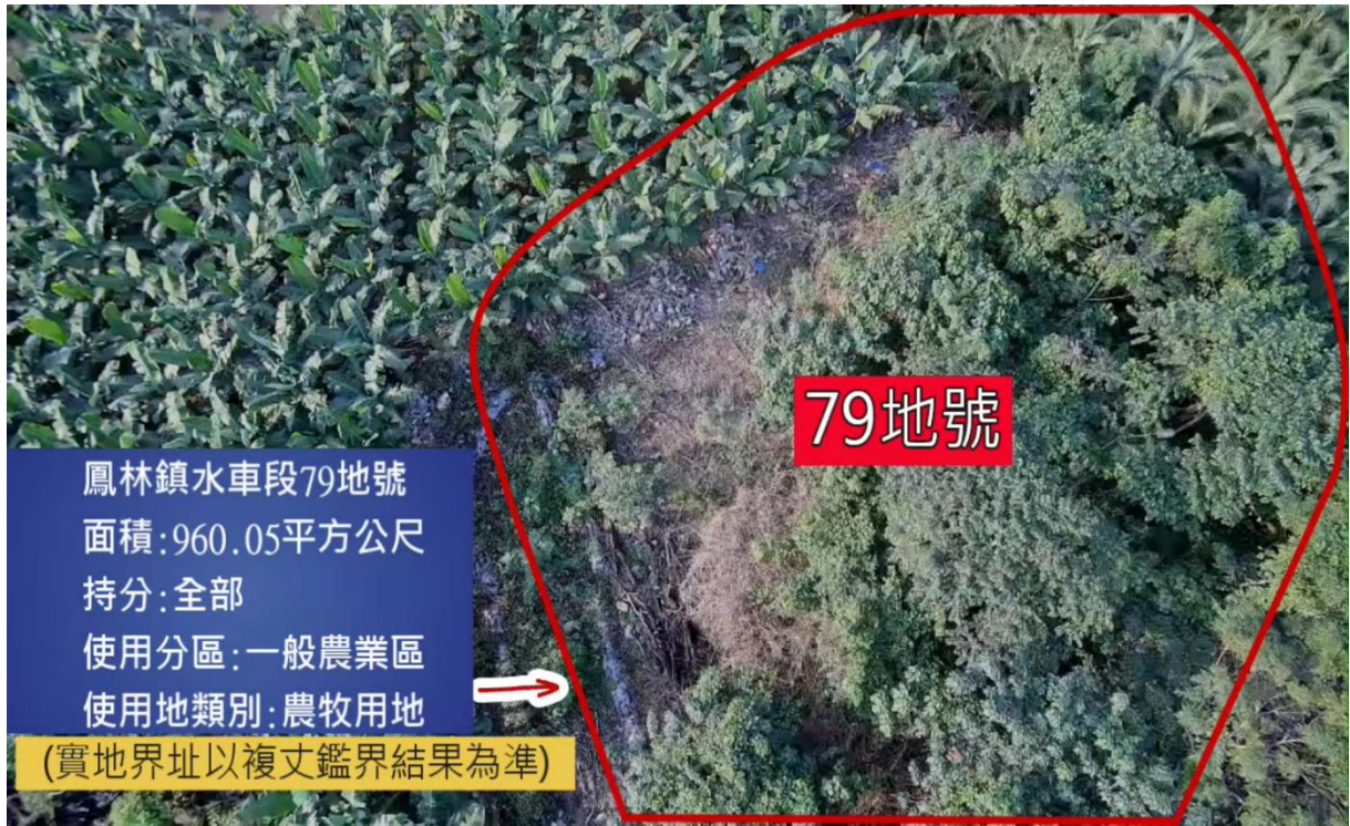
(花蓮縣鳳林鎮水車段土地空拍畫面)