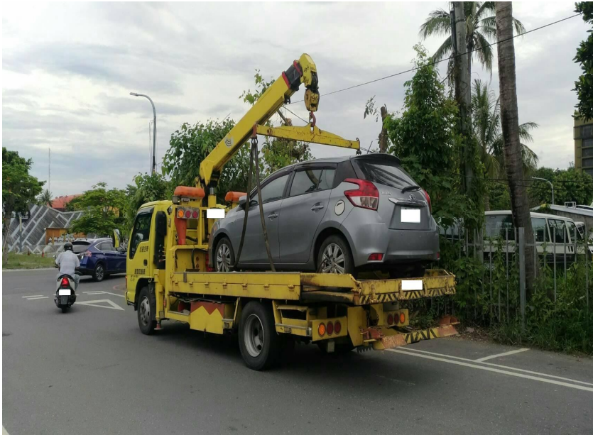
(圖為花蓮分署結合路邊停車收費機制查扣車輛，展現執法決心！)