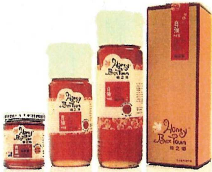
風味蜜 320克 370元 700克 800元 980克 1000元

畜養豬隻與光豐地區農會合作生產肉類加工品，均檢驗合格且通過ISO22000與HACCP危害分析重點管制品質認證。