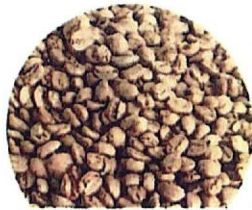
咖啡 400元 半磅