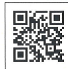
法務部 「More:法狀元」宣導網