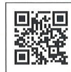
法務部 「More法狀元」宣導網