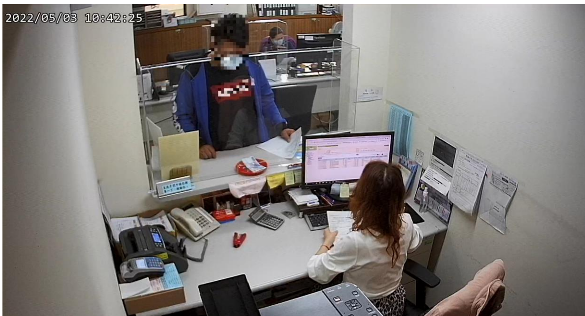
(方男繳納首期分期款項 2 萬元)