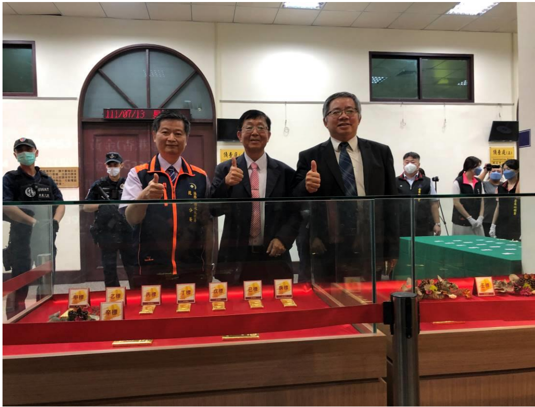
(法務部行政執行署署長林慶宗(中)、臺東地檢署檢察長戴文亮(右)、行政執行署花蓮分署分署長王金豐(左)蒞臨會場指導)