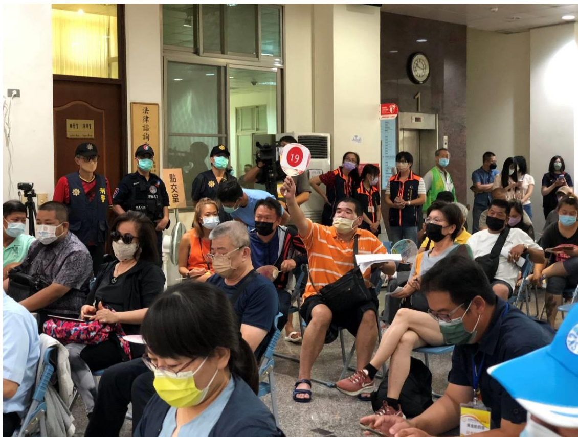
(現場民眾相當踴躍喊價激烈)