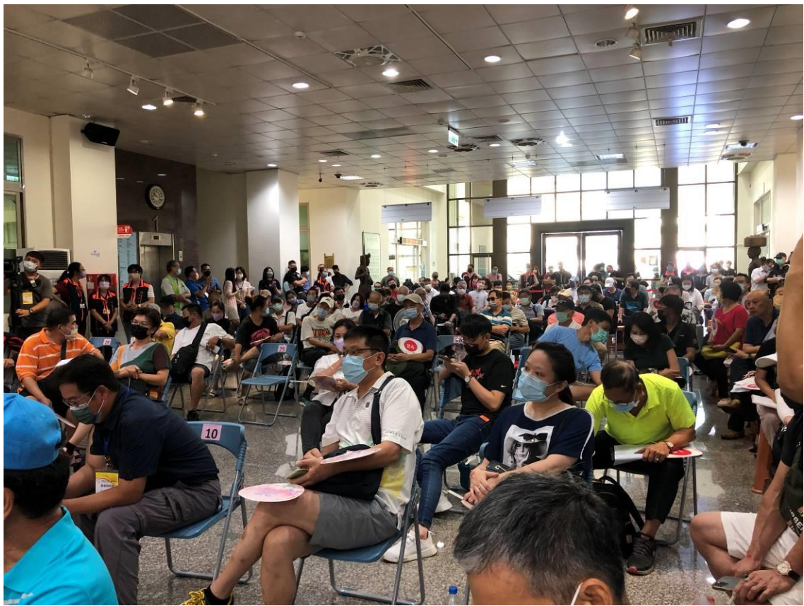
(到場應買人數眾多擠爆現場)