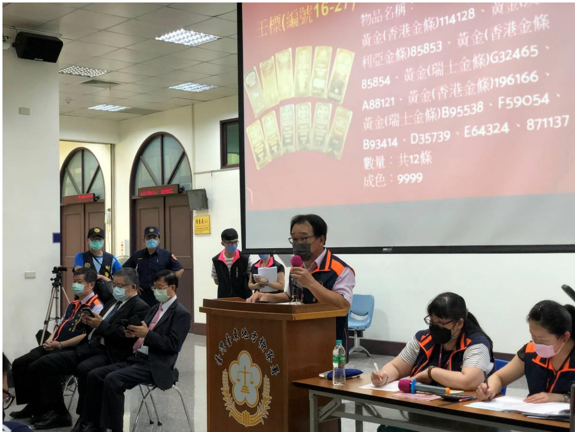
(執行署花蓮分署拍賣官主持拍賣程序)