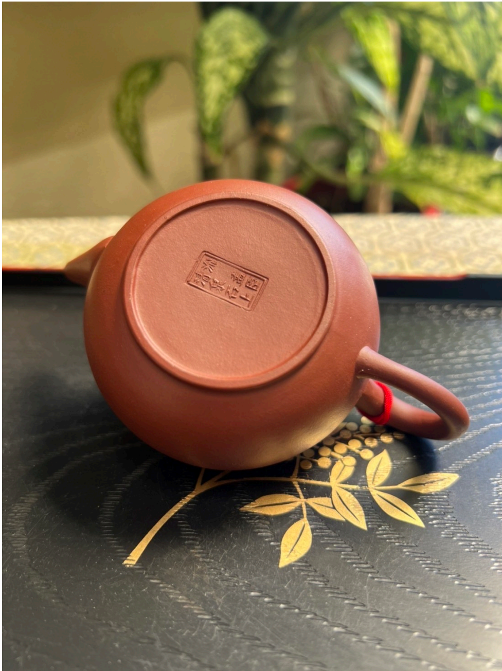
變賣茶具組 (17,000 元)