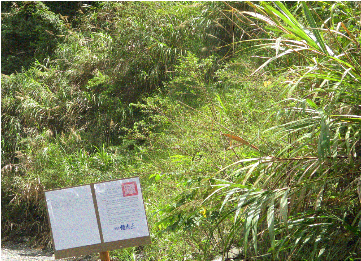
拍賣「台東縣達仁鄉土坂段 527-29 地號」土地