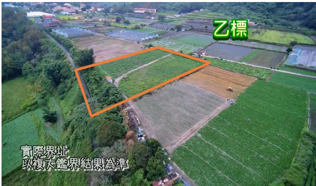
（臺東縣海端鄉利稻段良田美地，值得關注）