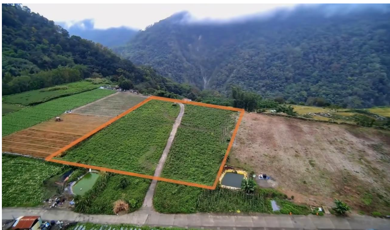
（臺東縣海端鄉利稻段土地，環境清幽，景色優美）