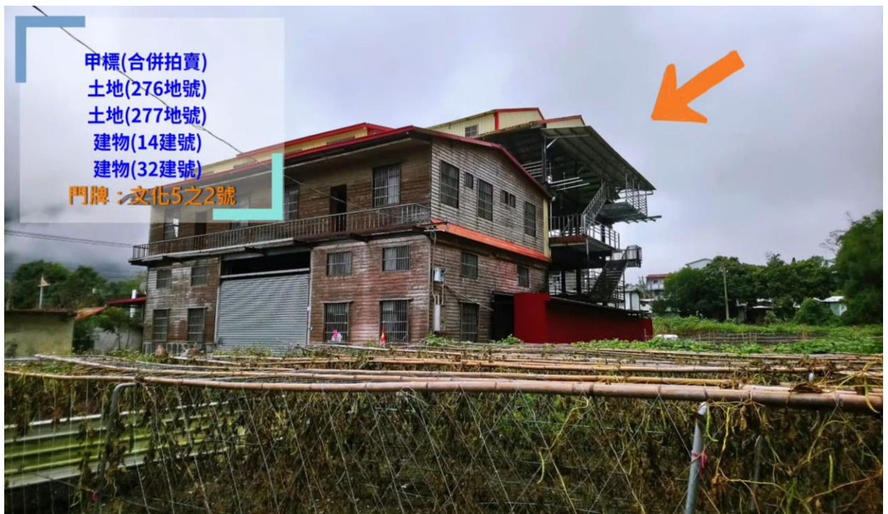
(臺東縣海端鄉利稻段大型倉庫)