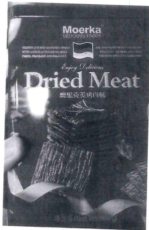
(本件非洲豬瘟裁罰案件遭查獲的豬肉乾)