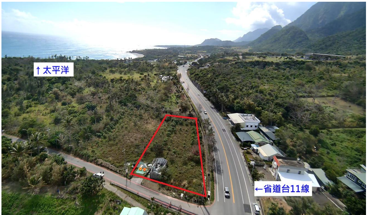
(臺東縣成功鎮南都歷段 556 地號空拍畫面[實際界址以鑑界結果為準]，東海岸山海美景盡收眼底)