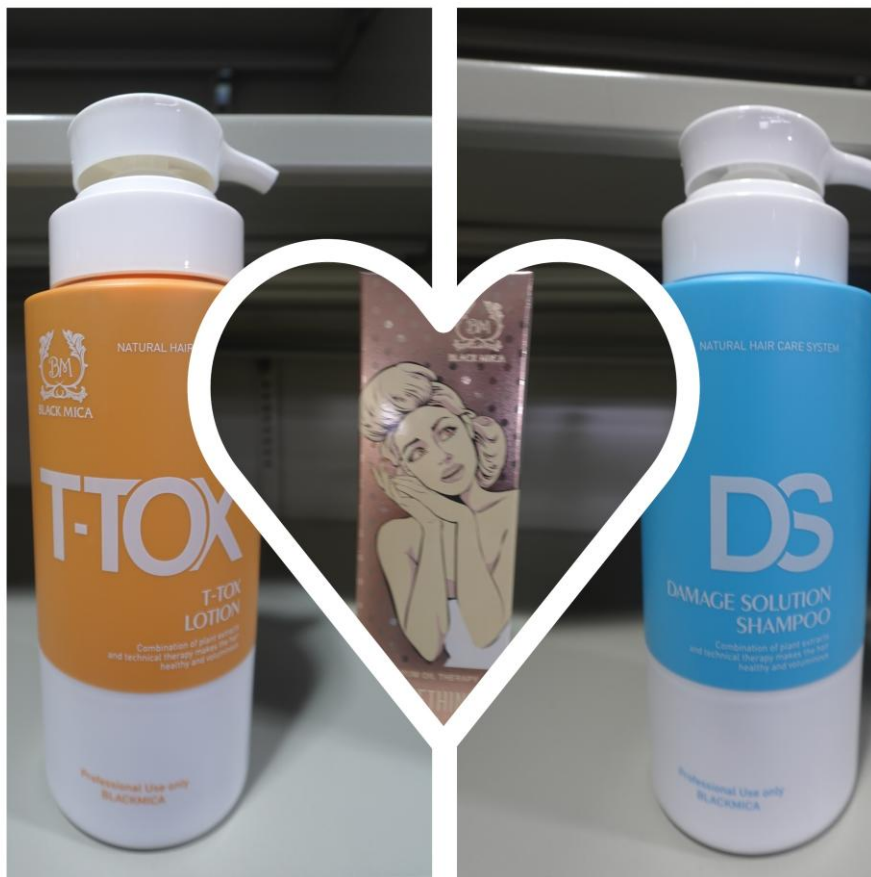
(多款寵愛媽媽之韓系護髮商品)