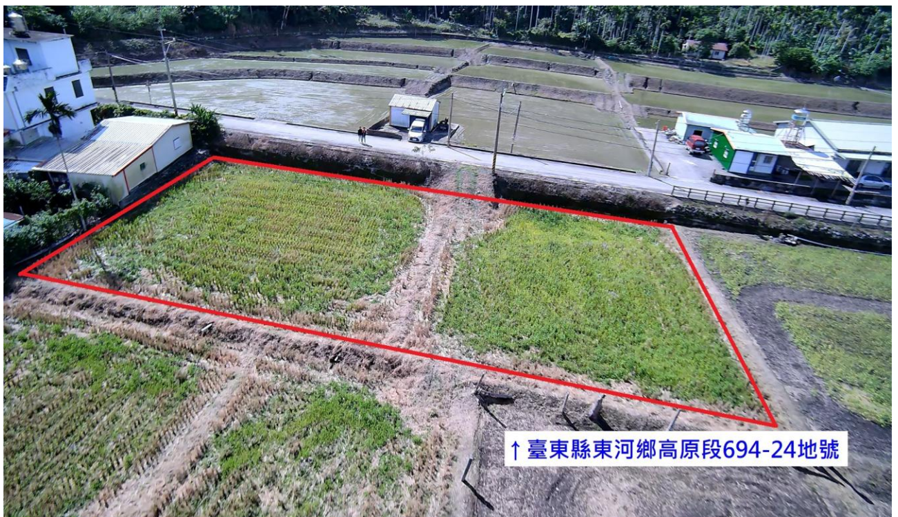
(臺東縣東河鄉高原段 694-24 地號空拍畫面[實際界址以鑑界結果為準])