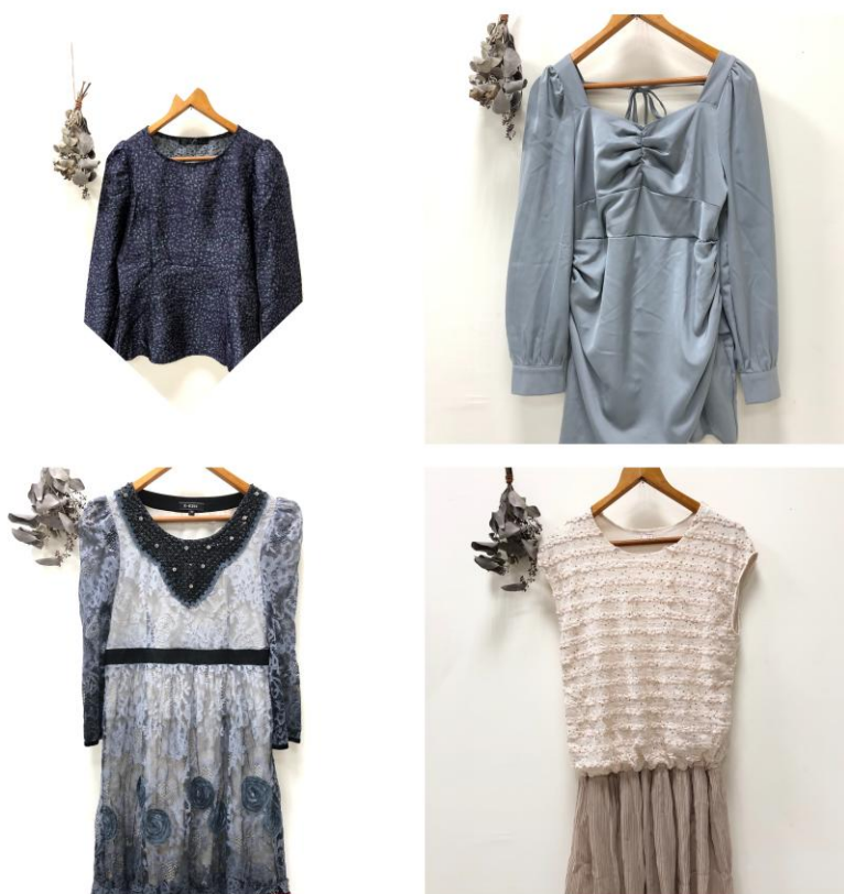
(價格親民之韓系服飾)